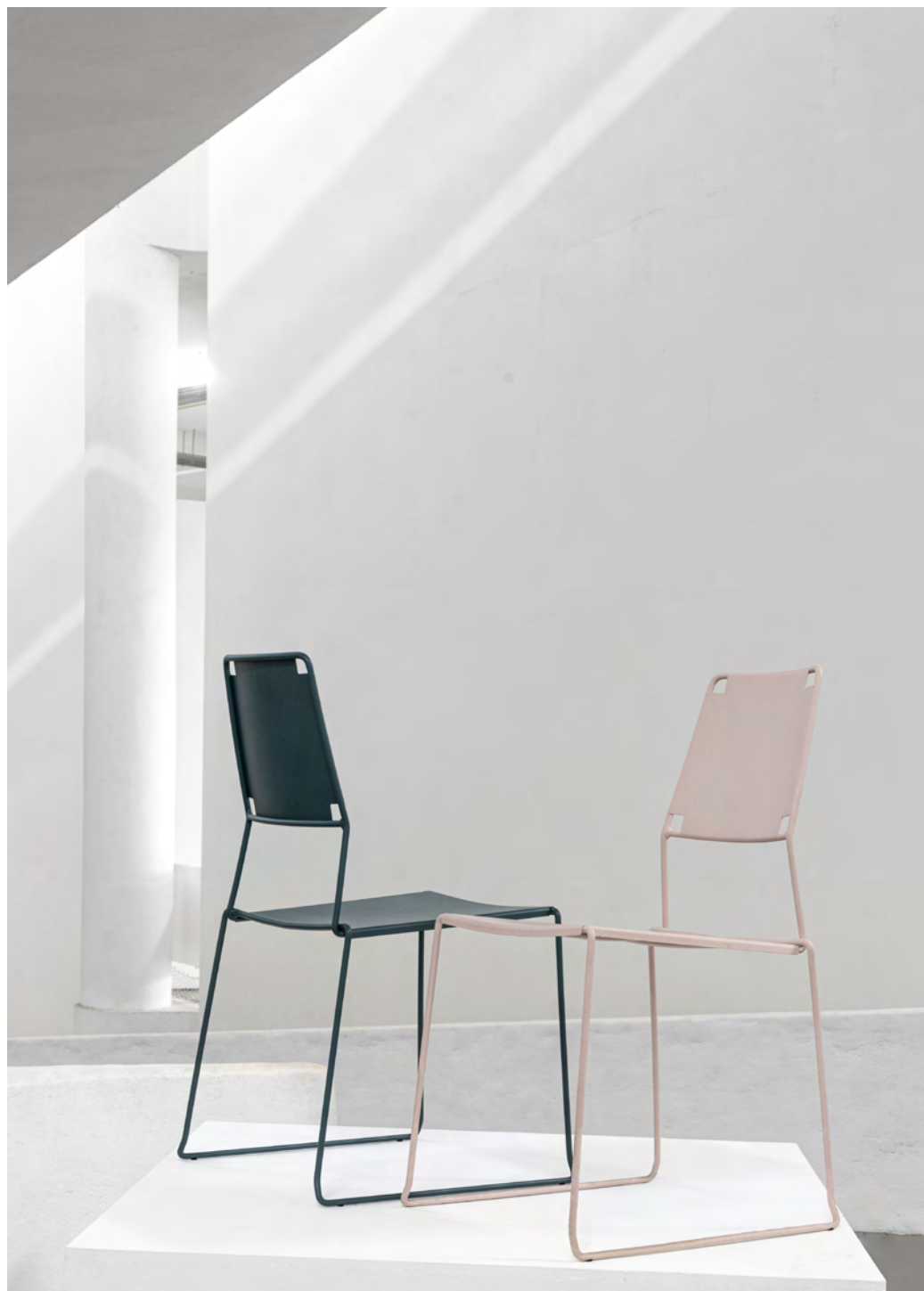
Cadeira Obi / Obi chair