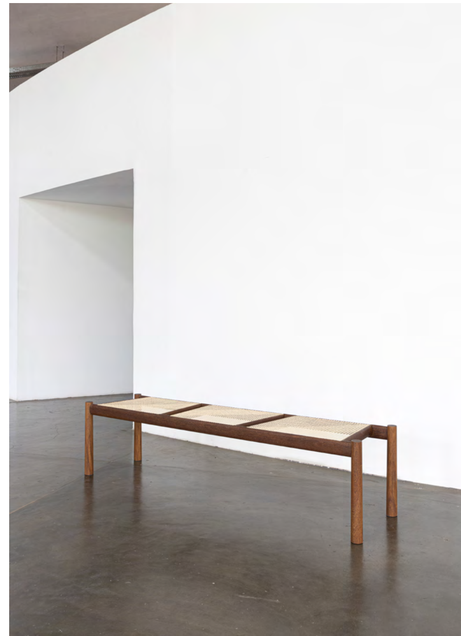
Banco Equador / Equador bench