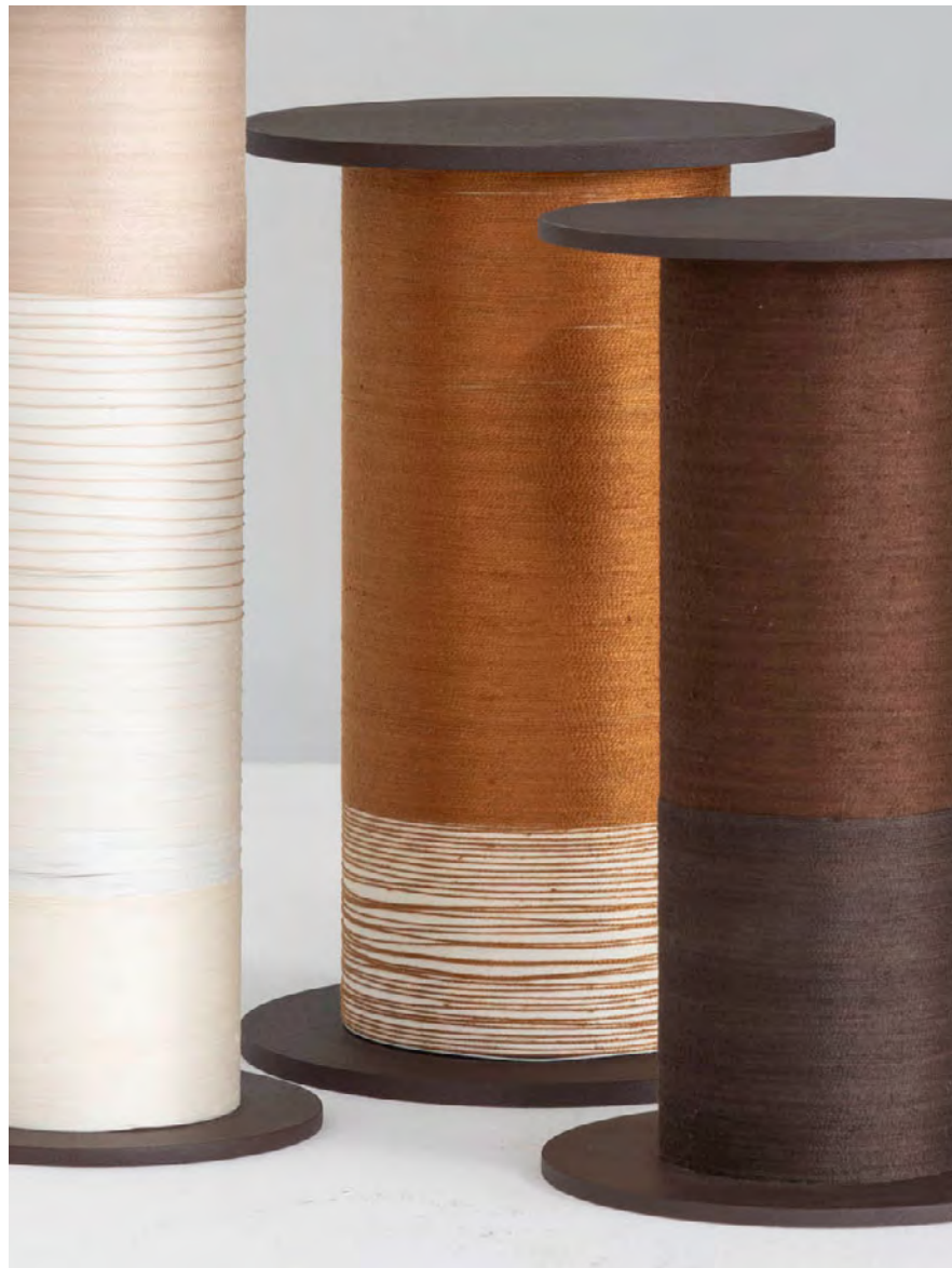
Série Fios / Fios series