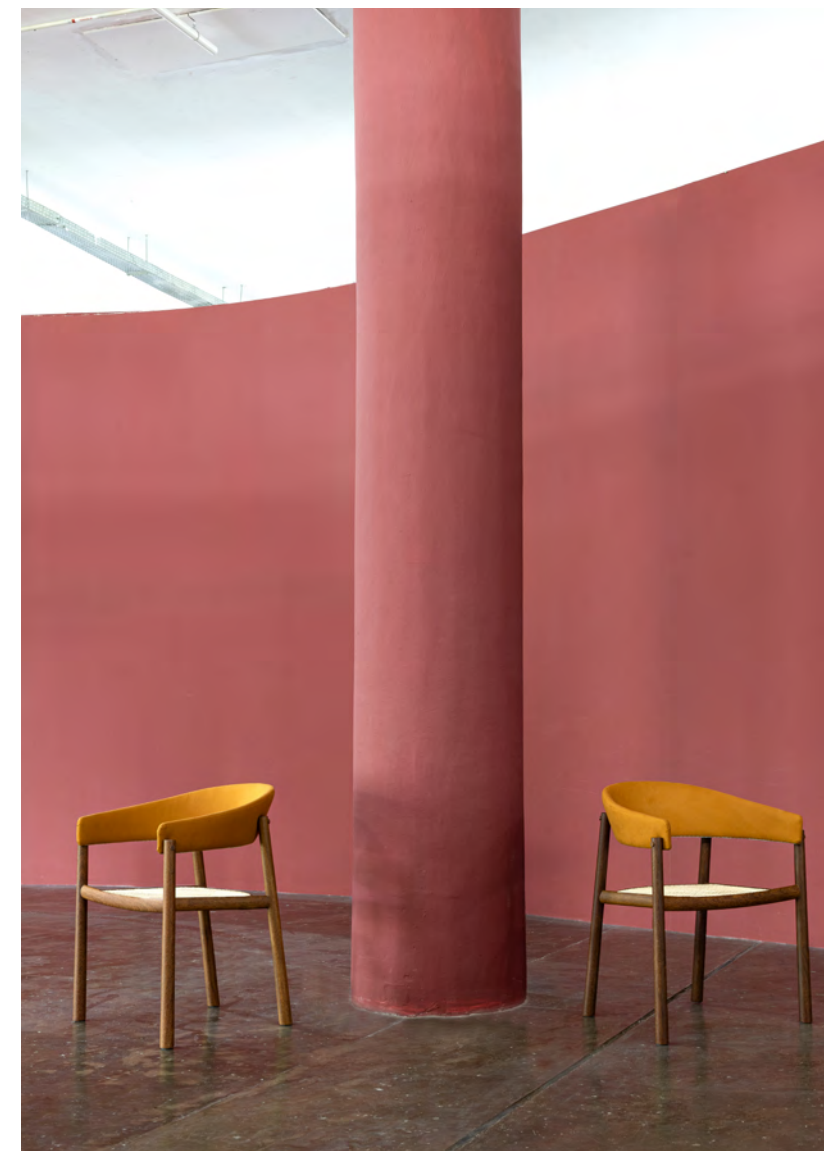
Cadeira Equador / Equador chair