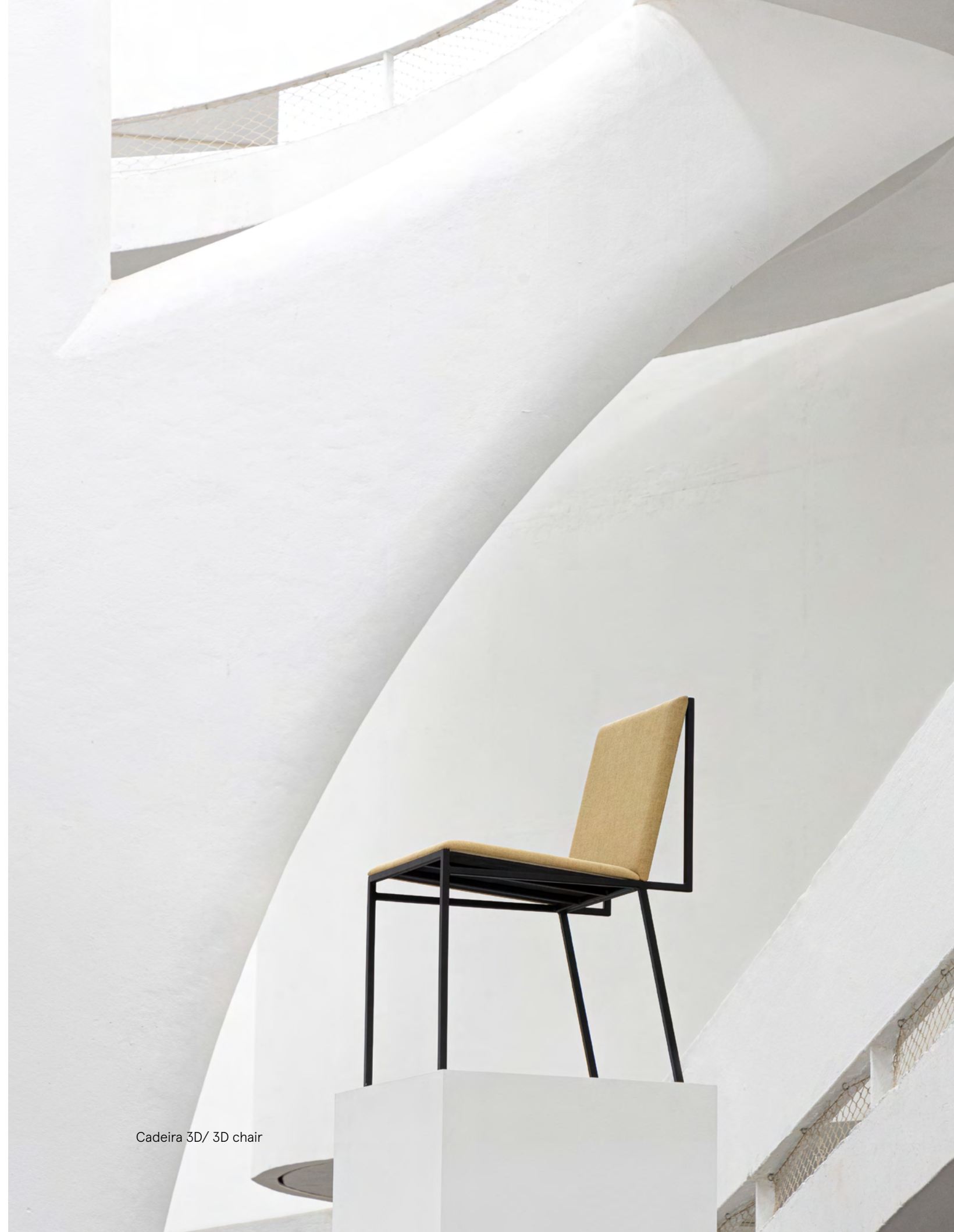
Cadeira 3D/ 3D chair