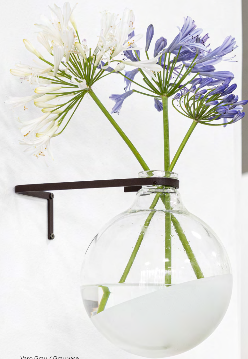
Vaso Grau / Grau vase