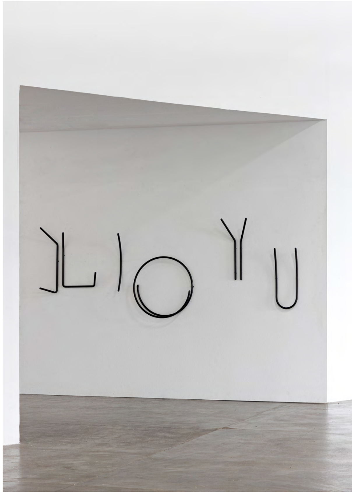
Série Grafia / Grafia series