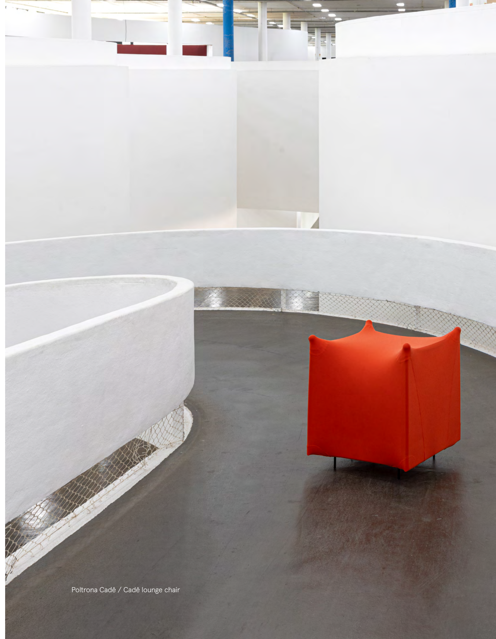
Poltrona Cadê / Cadê lounge chair