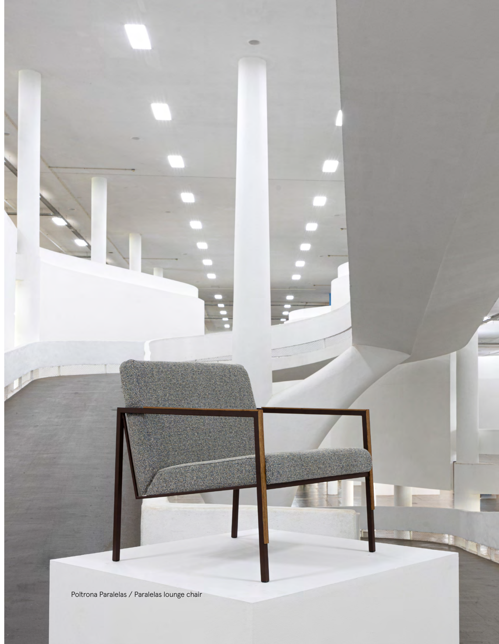
Poltrona Paralelas / Paralelas lounge chair