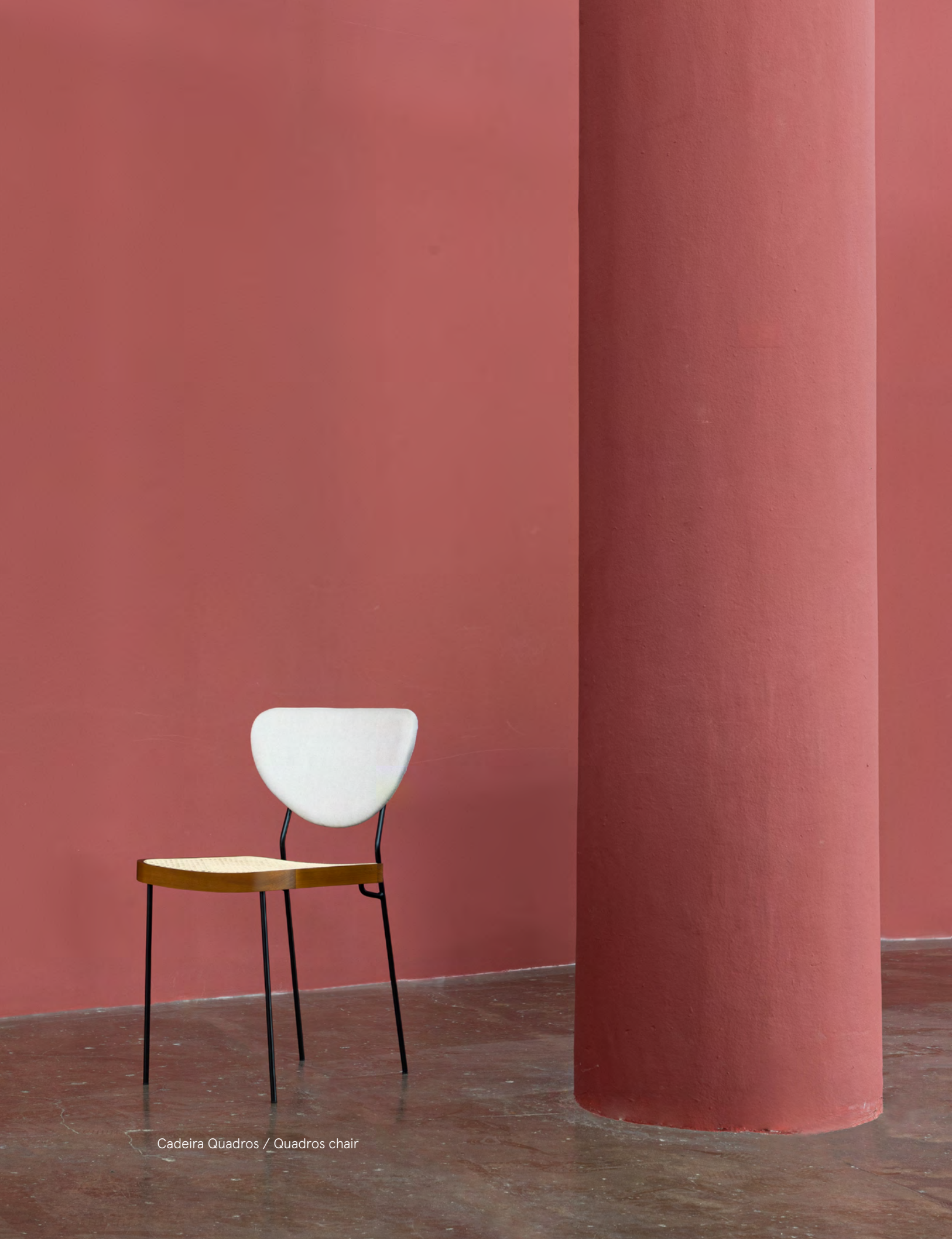
Cadeira Quadros / Quadros chair