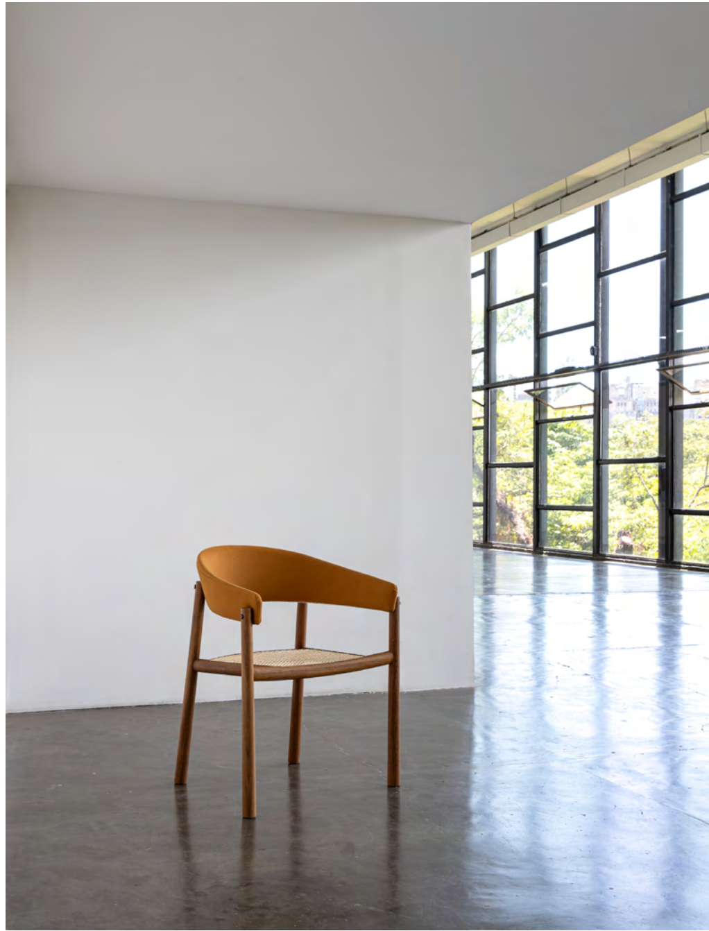
Cadeira Equador / Equador chair