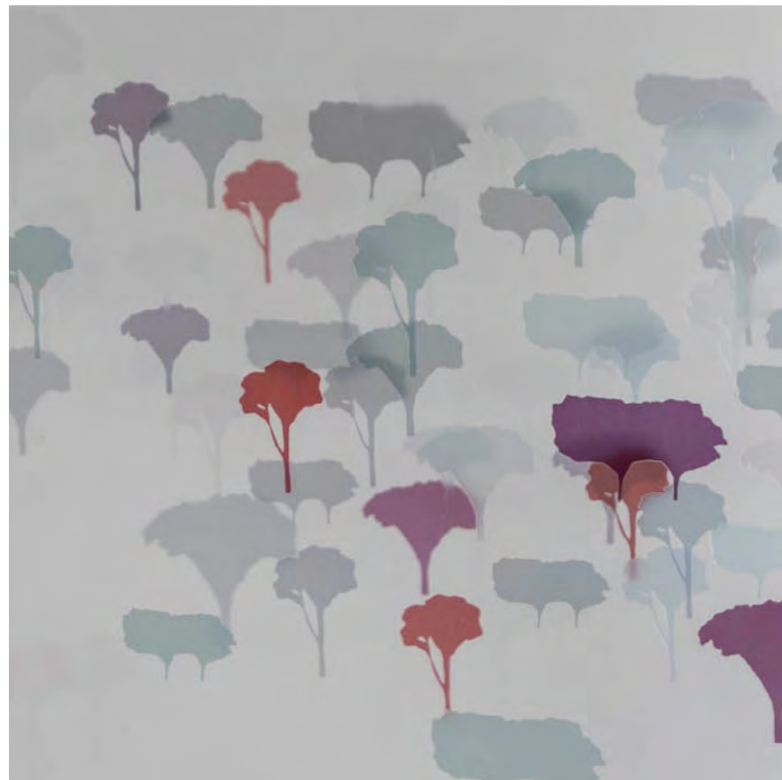
Através / Através