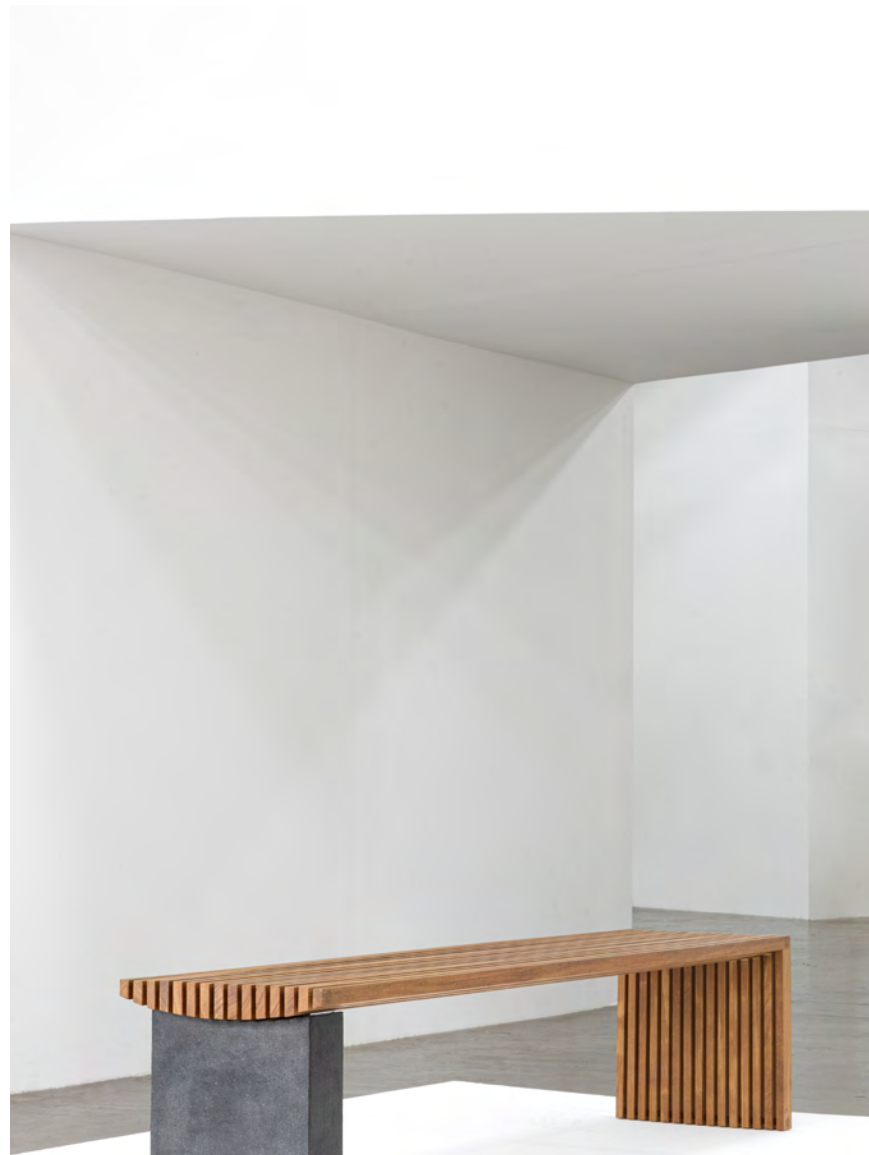
Banco Semibreve / Semibreve bench