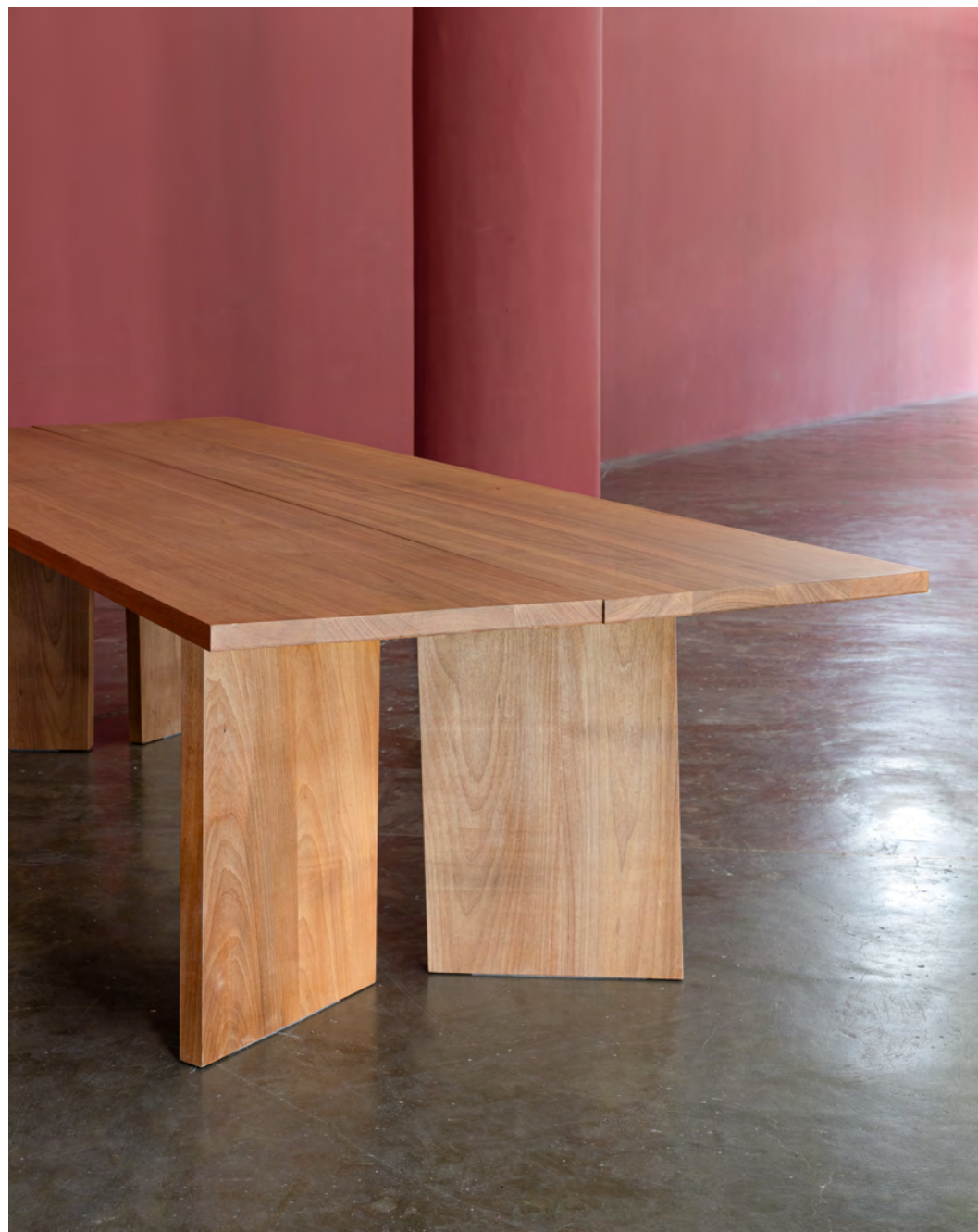
Mesa Compasso / Compasso table