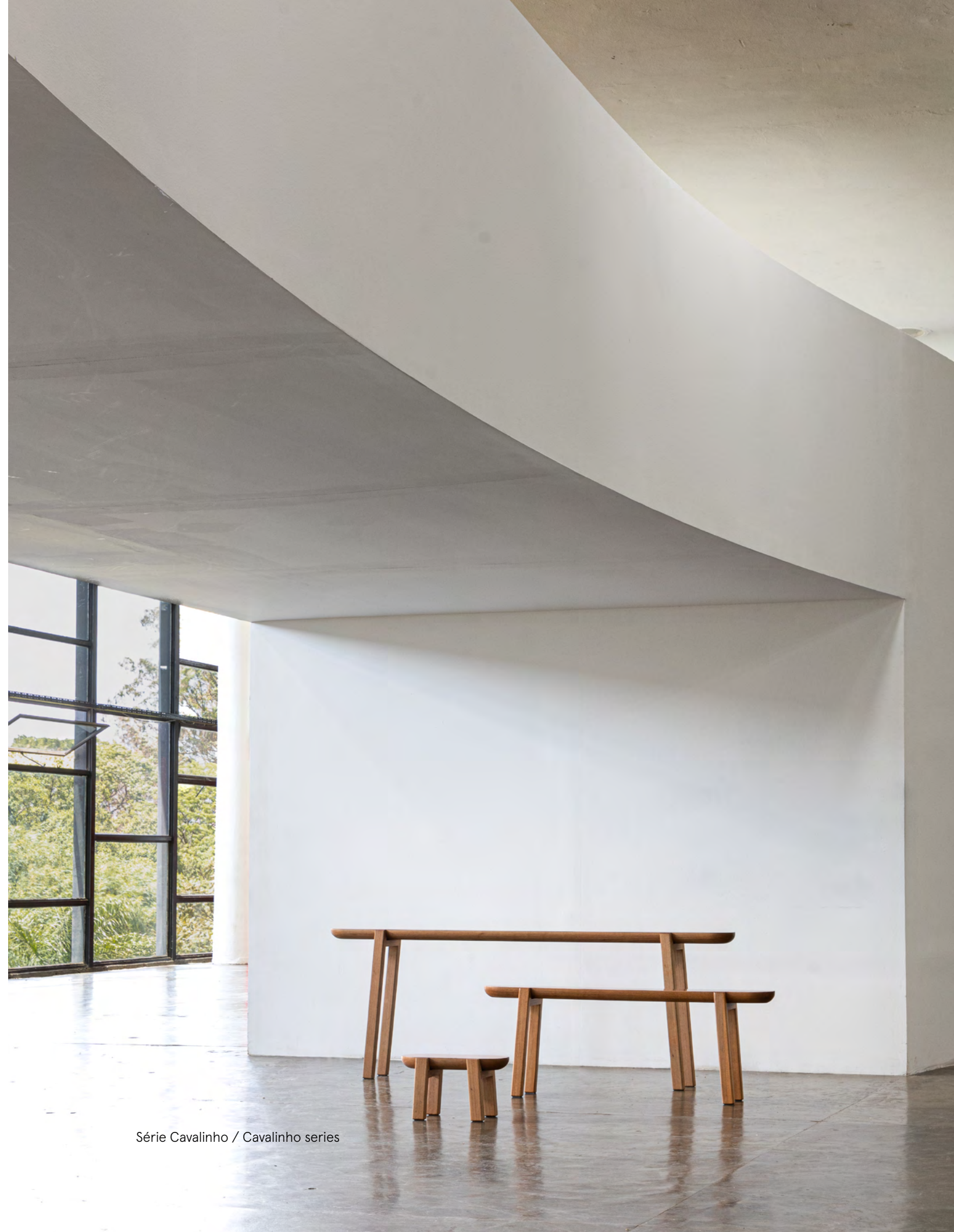
Série Cavalinho / Cavalinho series