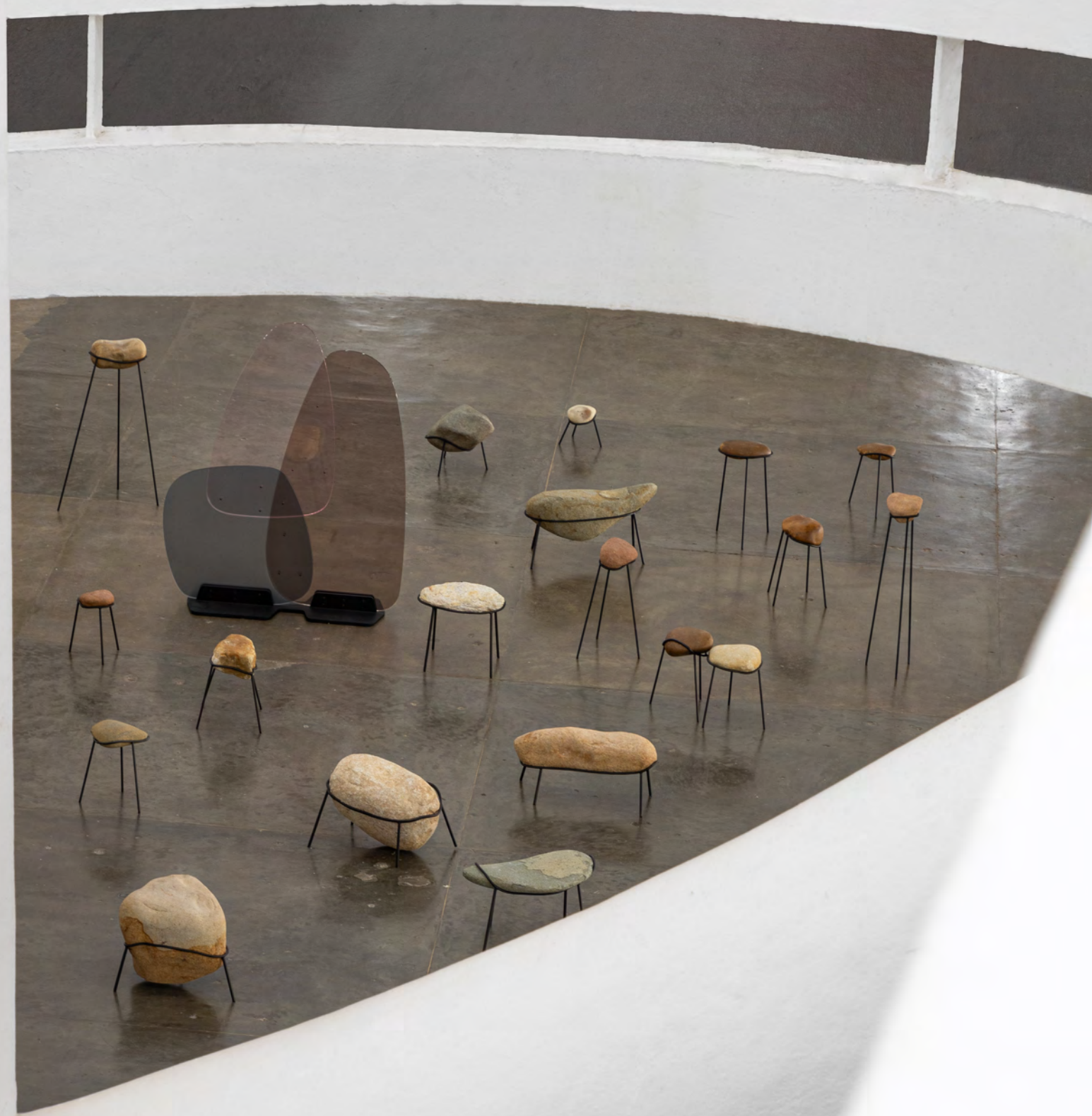
Série Rio / Rio series