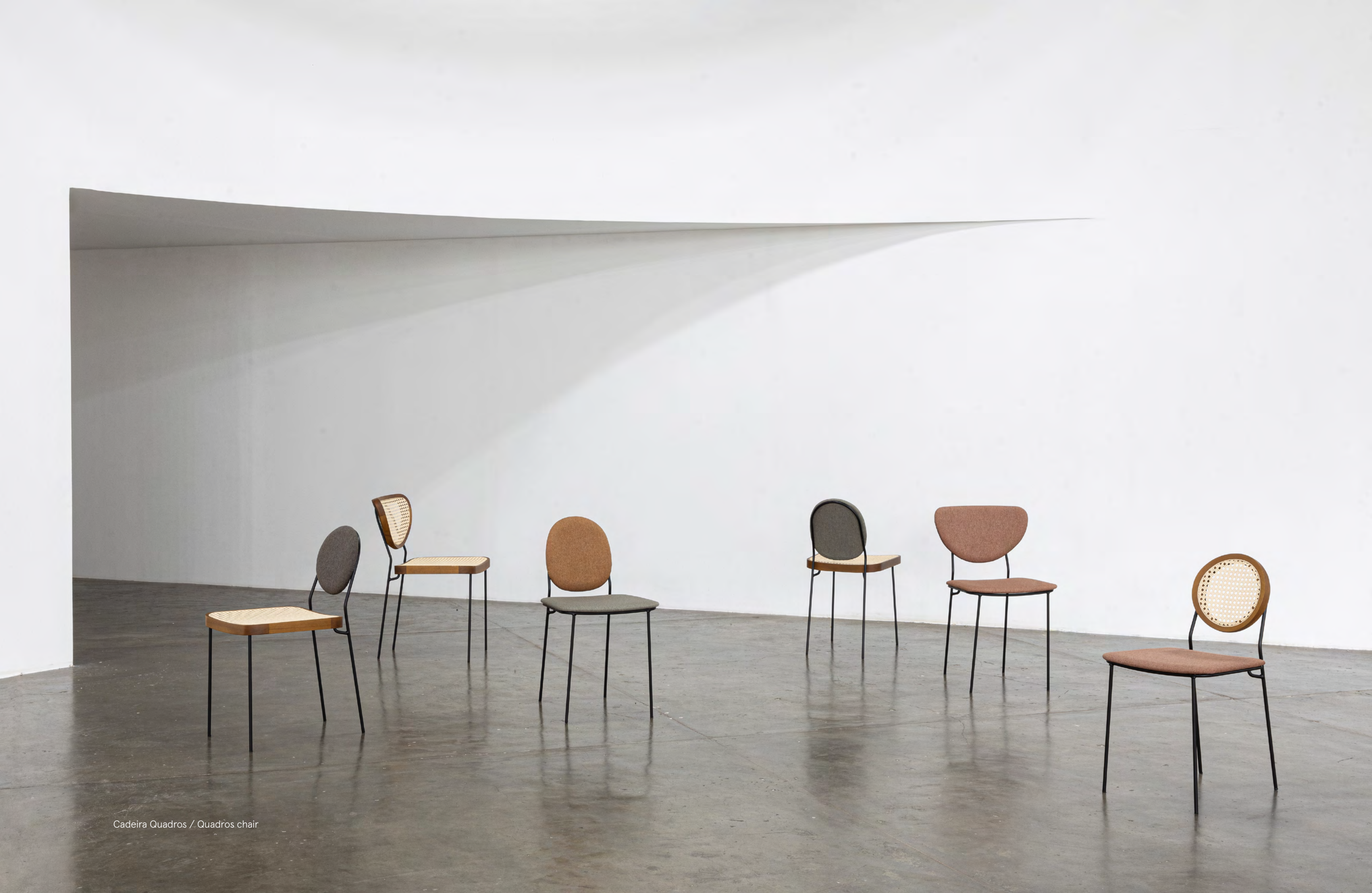
Cadeira Quadros / Quadros chair