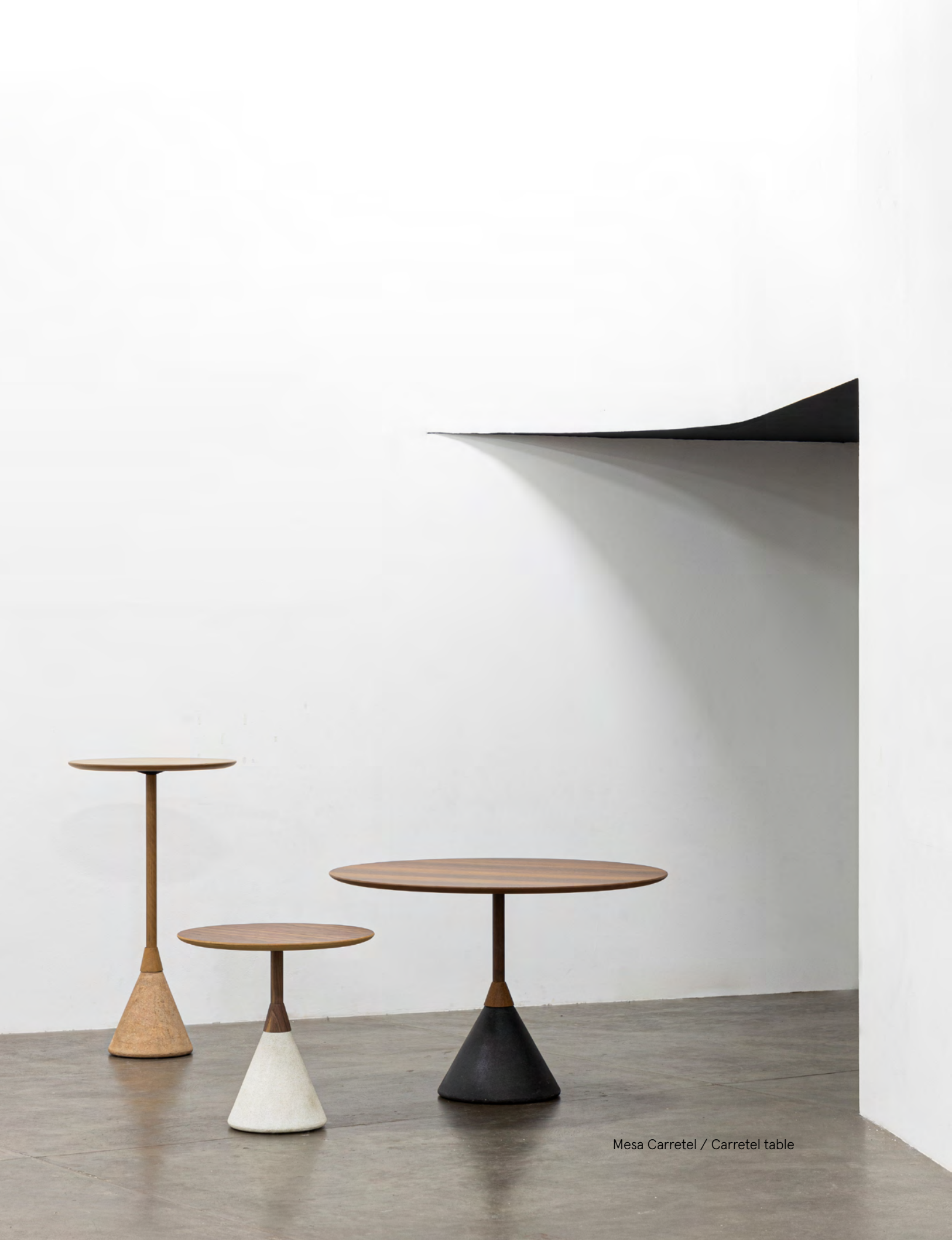
Mesa Carretel / Carretel table