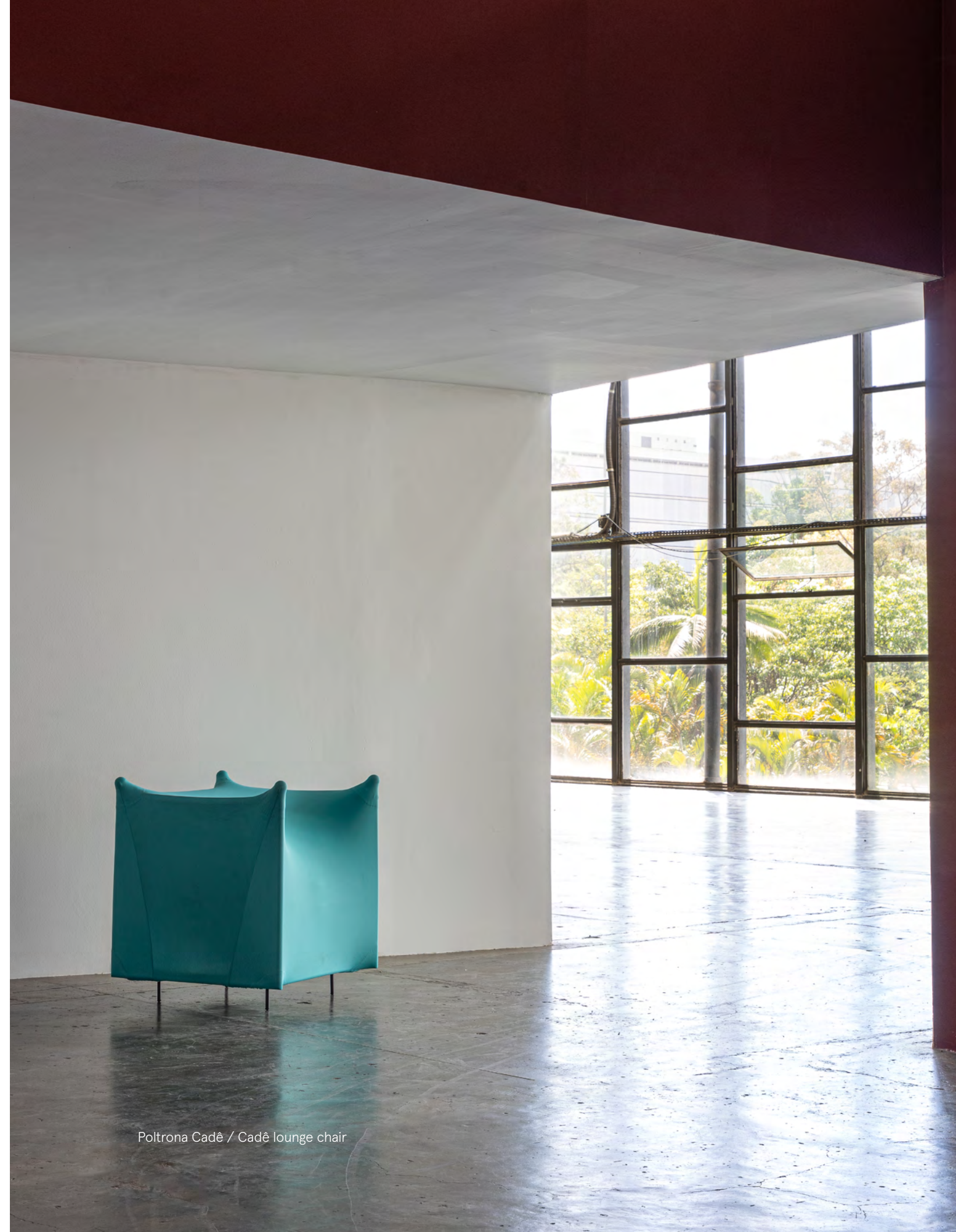
Poltrona Cadê / Cadê lounge chair